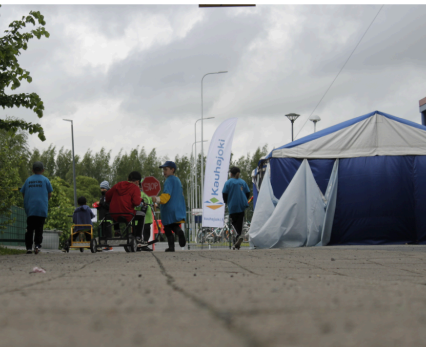
Päivän kuva Aapo V. – Poliisit ahkerana töissä.

– Tänään opin jotain tärkeää, Topi tuumi tyytyväisenä ja jatkoi matkaansa.