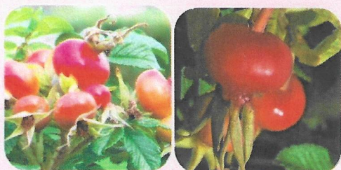
Kiulukat punaiset ja nauriinmuotoiset