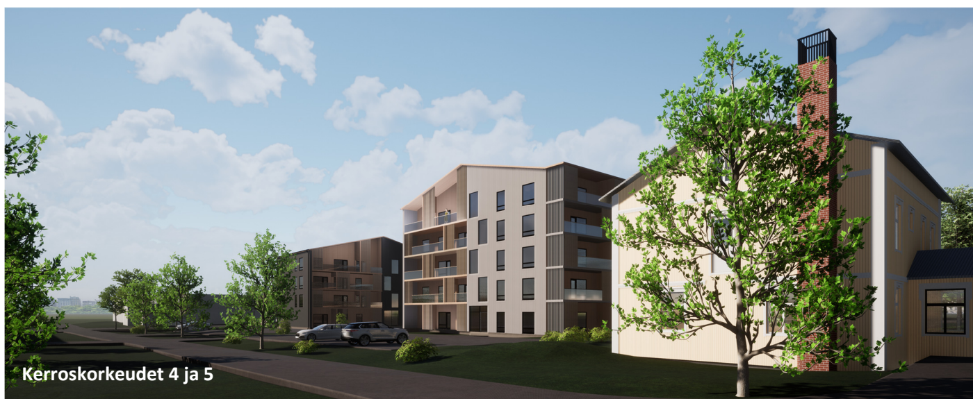
Kerroskorkeudet 4 ja 5