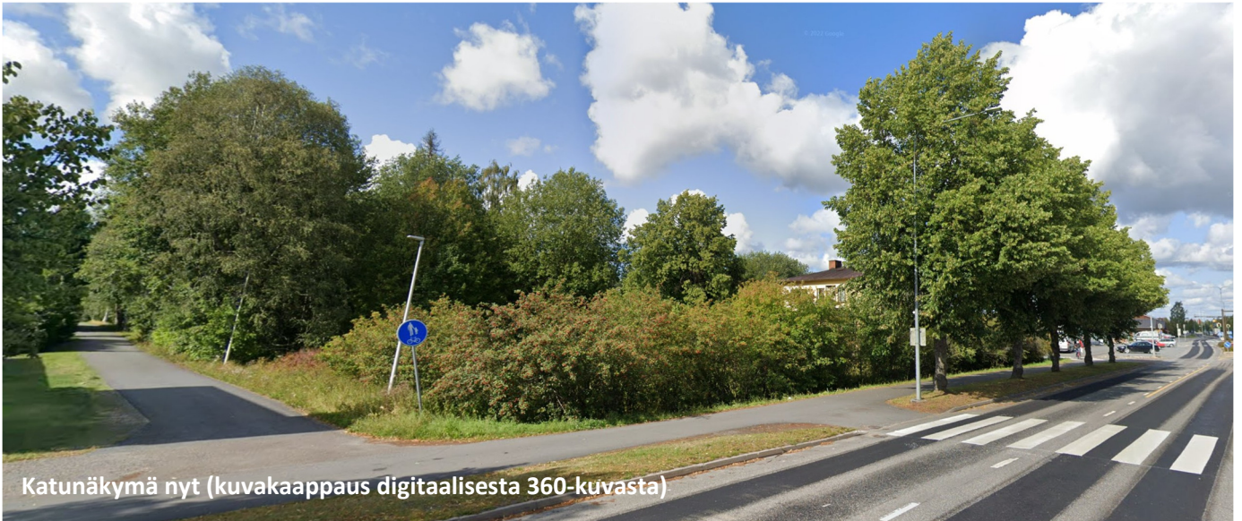
Katunäkymä nyt (kuvakaappaus digitaalisesta 360-kuvasta)

Näkymä Puistotieltä kohti luodetta, vasemmalla näkyy Museotie (kävelytie), oikealla takana hämmöttää Ykköskulma