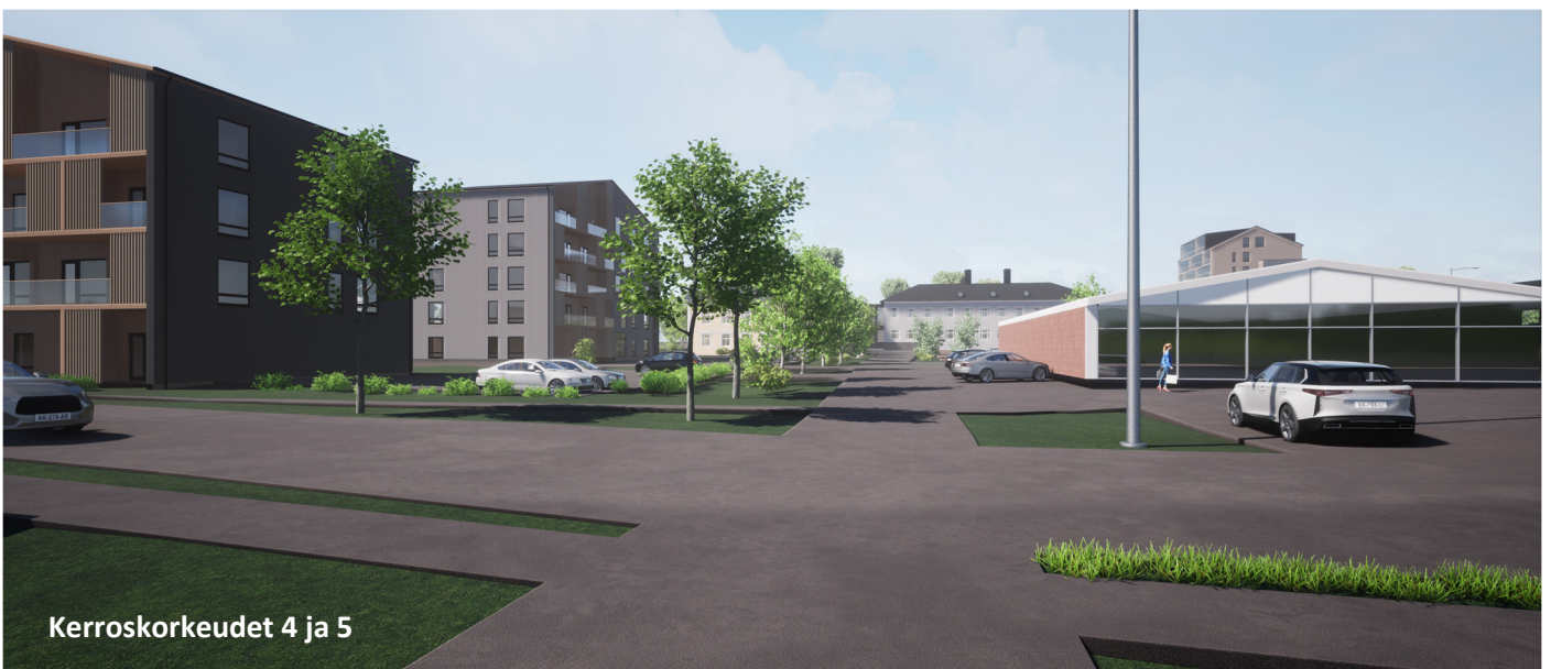
Kerroskorkeudet 4 ja 5