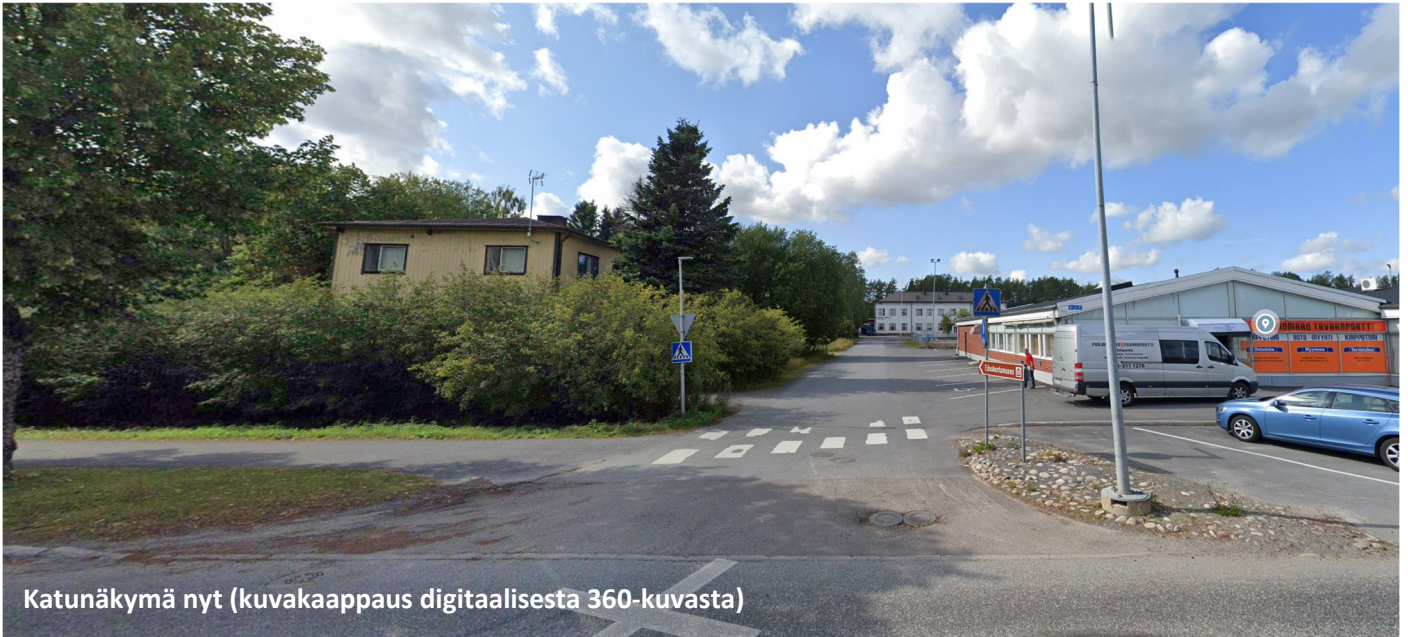
Katunäkymä nyt (kuvakaappaus digitaalisesta 360-kuvasta)