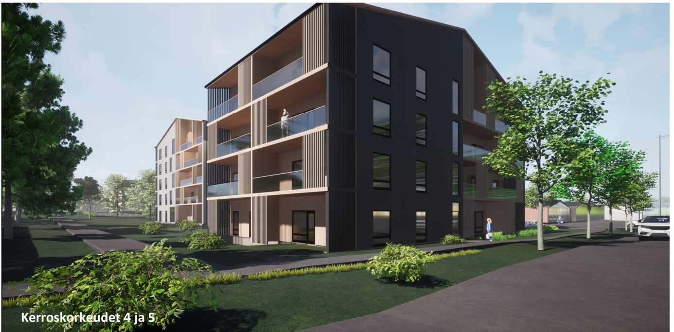
Kerroskorkeudet 4 ja 5