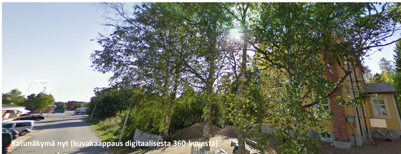
Katunäkymä nyt (kuvakaappaus digitaalisesta 360-kuvasta)

Näkymä Eduskunnankadun päästä Sanssin kulttuuritalon edustalta kohti Puistotietä