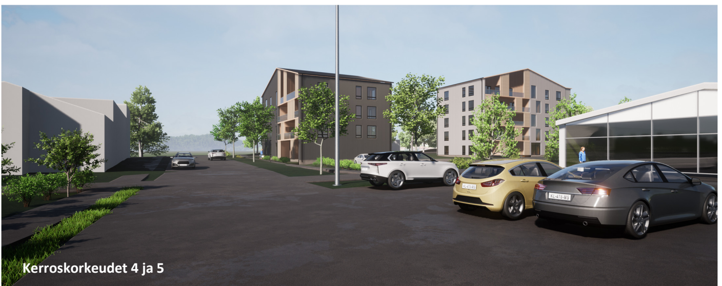
Kerroskorkeudet 4 ja 5