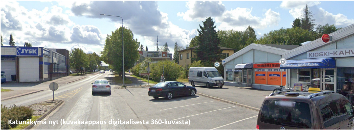
Katunäkymä nyt (kuvakaappaus digitaalisesta 360-kuvasta)